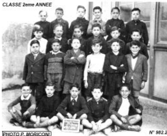
STE-ANNE ANNEE 1943 / 1944 ECOLE COMMUNALE DE LA RUE THIEUX CLASSE 2eme ANNEE

Ecole de garçons 1943/1944 de la rue Thieux. Si vous les reconnaissez, vous pouvez nous aider à compléter ces documents.