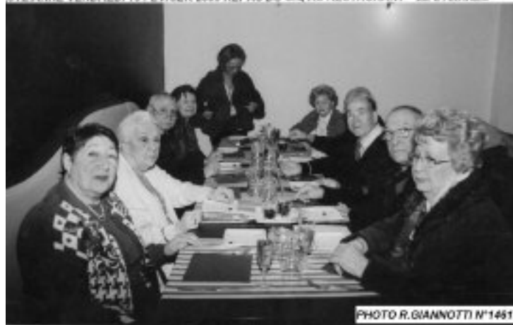
STE-ANNE VENDREDI 13 FEVRIER 2009 REPAS DU CIQ AU RESTAURANT " LE LYLIANES "

Tout le monde garde un bon souvenir de ce moment passé ensemble. Le repas était excellent, merci au restaurant et au Chef et l'ambiance était bonne, merci à tous les participants